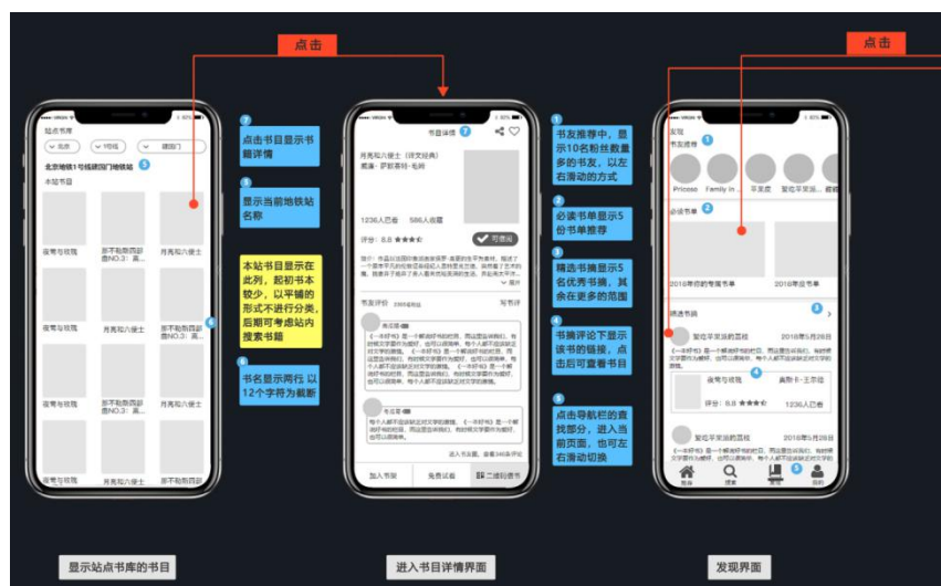
图：手机版原型图示例

要注意的是，原型做的特别好，但是最后你的代码成果达不到原型的标准的话，“甲方爸爸”、“上司领导”、“眼巴巴期待你的用户们”就会有意见了，因此做原型或者原型图的时候也需要考虑实际因素（能力、时间等，以后你们工作了还会有经济因素），确保你们能够在有限时间内用代码实现出原型的样子，或者做的比原型更好（前提是这个“好”是利益相关人的想法，不能仅仅是你或者你团队的想法）